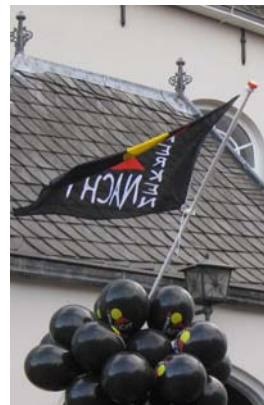
Kerkennachtvlag hangt uit

Plaatsen die mee willen doen met de kerkennacht in 2015 rond 21 juni kunnen zich melden bij het bureau van de Raad van Kerken. Hun gegevens zullen dan doorgespeeld worden naar de landelijke coördinatie, zodat ze kunnen meedoen met de gezamenlijke voorbereiding.