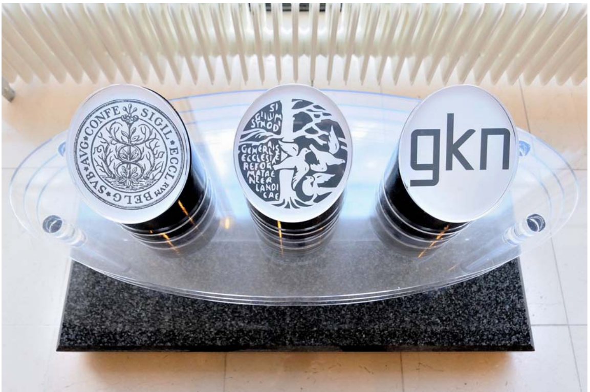
Beeld van de drie kerkgenootschappen in de hal van het Dienstencentrum in Utrecht, gevat in één object.