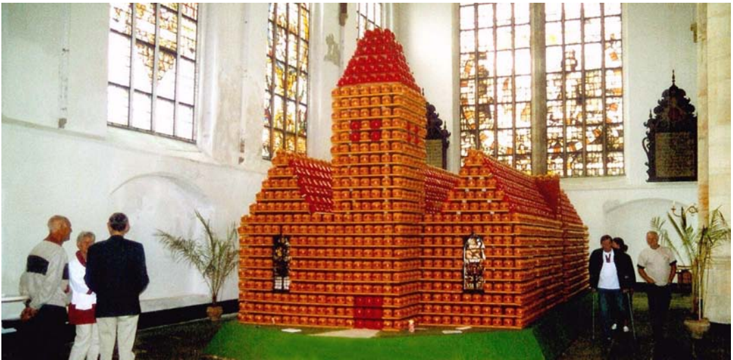
Kerk van kaas in de kerk

Edammers, kerkelijk of niet, hebben zich ingezet voor het welslagen van het project. Het bleek mogelijk met de opbrengst van de actie (en met subsidie van de Rijksdienst Monumentenzorg) de klokkenstoel te restaureren en een andere klok te gieten. De kerk heeft nu weer twee klokken. De Grote Kerk kwam door deze actie weer in de belangstelling te staan van de Edammers en werd een belangrijk uithangbord van de kerkelijke gemeente.