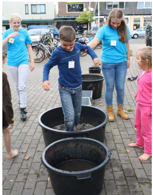
Jongeren helpen kinderen bij het spel

Jongeren in de leeftijd van 12 tot 17 jaar nemen in het kader van M25 (M-Twentyfive) in Leiden deel aan veelsoortige activiteiten meldt Diaconie Bericht. Het project is in 2008 van start gegaan. Het recept blijkt heel succesvol te zijn. Jongeren worden - geïnspireerd door Matteüs 25 (de Werken van Barmhartigheid) - uitgedaagd, ondersteund en actief gemaakt om praktische hulp te bieden aan kwetsbare groepen in de samenleving. Van huis uit christelijk, islamitisch, hindoeïstisch of atheïstisch, iedereen is van harte welkom. Hoofddoel is jongeren aan den lijve te laten ervaren dat vrijwillige inzet voor anderen die het vaak wat minder hebben ook voor jezelf verrijkend, inspirerend, confronterend en uitdagend is.