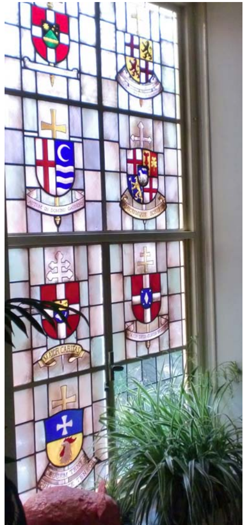
Raam in het gebouw waar de Raad huist, met daarin de wapenspreuken van de oud-katholieke bisschoppen.

De bijeenkomst vindt plaats op 12 september a.s. van 13.30 - 16.30 uur bij de Raad van Kerken, Koningin Wilhelminalaan 5, Amersfoort. Inloop vanaf 13.00 uur; nadien gelegenheid voor een informele ontmoeting. Opgave via rvk@raadvankerken.nl .