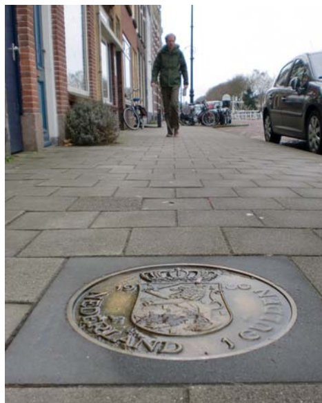
Herinnering in de straat aan de Nederlandse gulden

Op het moment dat de Europese verkiezingen worden gehouden (22 mei) zijn er leidinggevenden van alle nationale raden van kerken in Europa op bezoek in Nederland. Zij treffen elkaar in Egmond voor een jaarlijkse afstemmingsvergadering. Op de website komen verslagen daarvan. De religies in Nederland zijn van plan de verkiezingen aan te grijpen om te pleiten voor ruimte voor religies in het publieke domein.