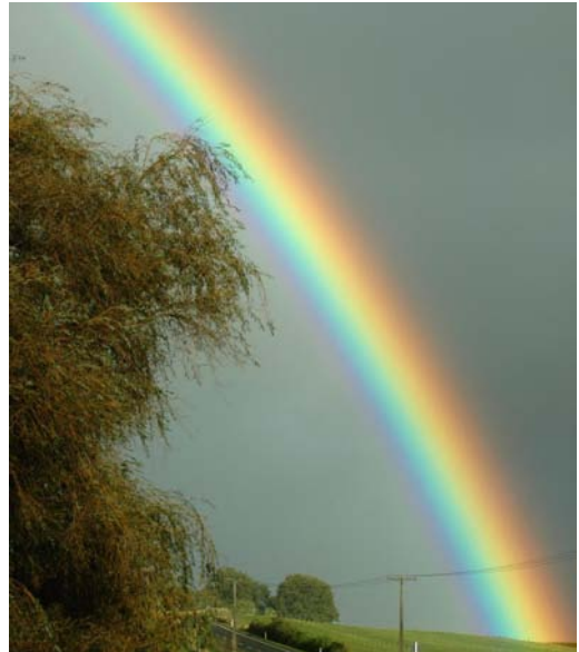
De natuur: om van te genieten en te bewaren

heid in een bepaald gebied. In 2002 trokken ze een week per boot over de Adriatische Zee en bespraken thema's die daar speelden. In 2007 bezochten ze de Noordelijke IJsee en in 2009 was het thema opgebouwd rond de Mississippi. Vanwege de inspanningen van patriarch Bartholomeus I op het gebied van duurzaamheid kreeg hij de bijnaam 'de groene patriarch'. De patriarch werd door Time Magazine verkozen tot één van de honderd invloedrijkste mensen ter wereld met waardering voor zijn spirituele benadering van het milieuvraagstuk. Tijdens zijn bezoek zal de patriarch uitgebreid ingaan op dit thema. Verbinding is echter een breder begrip bij de patriarch.