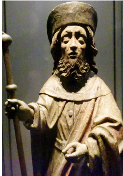
Pelgrim (Catharijneconvent, Utrecht)

Een pelgrimage heeft allereerst een spirituele dimensie, zij wordt niet voor niets ook wel omschreven als een 'bedevaart', een reis naar het heilige... het is een op weg gaan omwille van het geloof. Maar deze pelgrimage, tegen de achtergrond van een assemblee die oproep tot een kerk die zich inzet voor gerechtigheid en vrede vanuit het perspectief van hen die daaronder het meest lijden, is