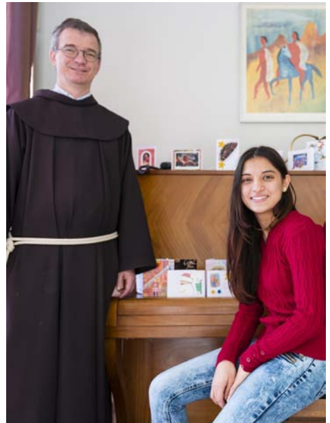
Stagiaire in franciscaans stadsklooster

Kerk en stage organiseert op woensdag 14 mei een oriëntatiemiddag voor iedereen in de kerk die zich wil oriënteren op mogelijkheden om met jonge mensen in de eigen kerk aan de slag te gaan. De bijeenkomst vindt plaats van 13.00 - 16.00 uur in de Bergkerk in Amersfoort. Opgave vooraf via rvk@raadvankerken.nl . Toegang gratis.